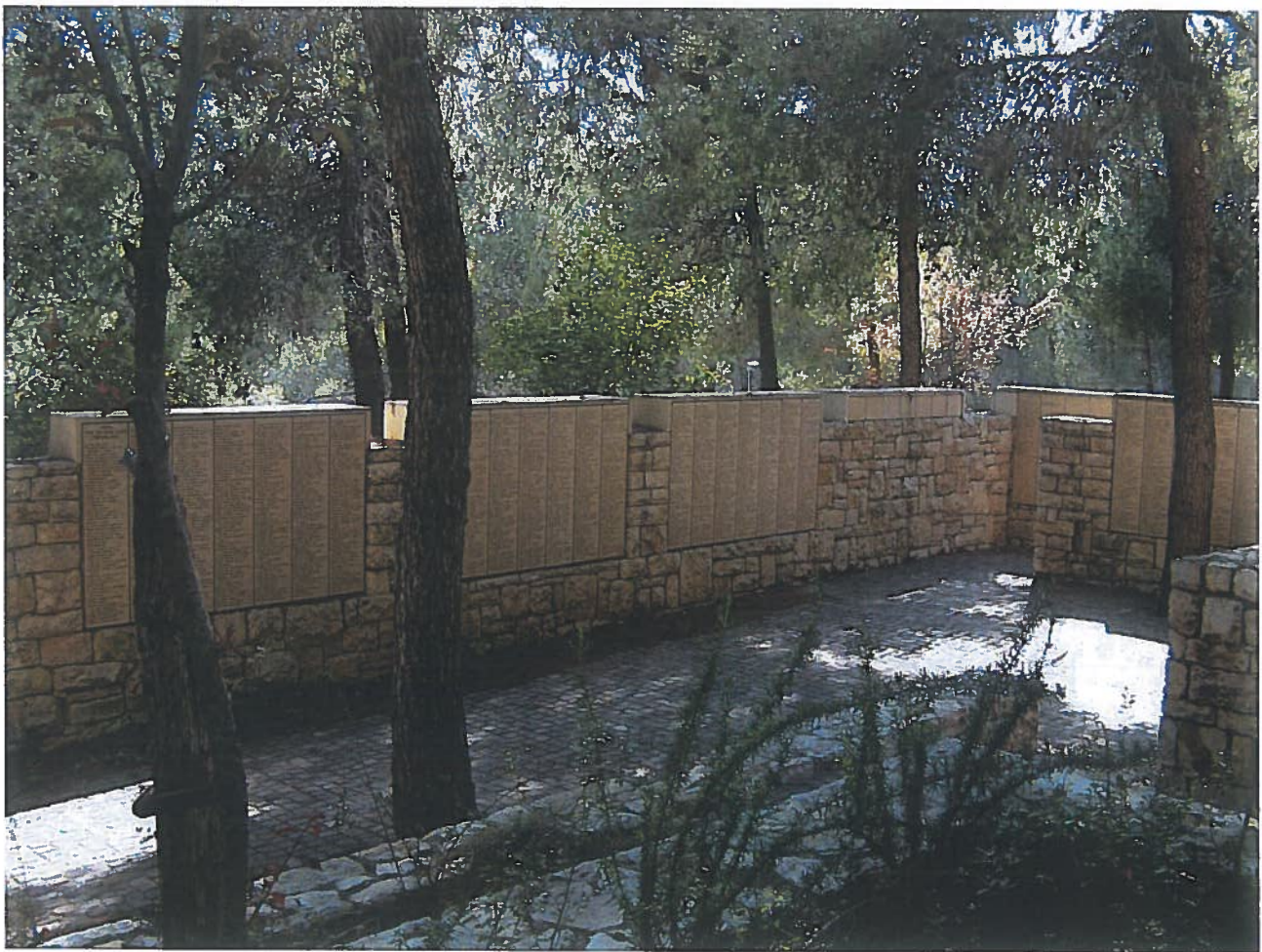
"Tuin der Rechtvaardigen", Yad Vashem Jeruzalem

op 14 april 2015 op de Ambassade van Israël te Den Haag