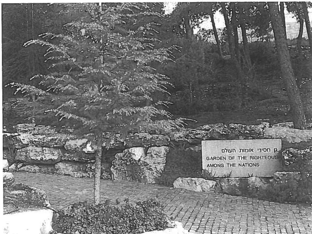
“Tuin der Rechtvaardigen”, Yad Vashem Jeruzalem

In de tuin der Rechtvaardigen onder de Volkeren bij Yad Vashem staat aan het begin van de Laan der Rechtvaardigen een monument ter ere van al deze onbekende onderduik-ouders.