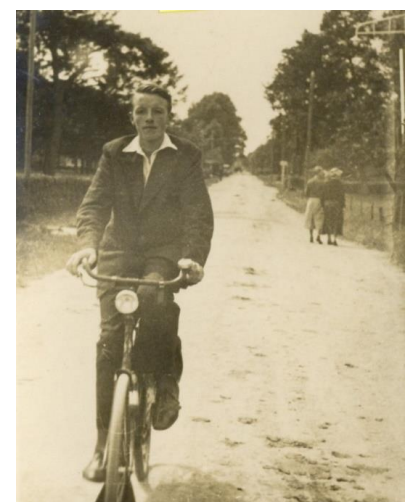
1937, schoolfeest Haule.