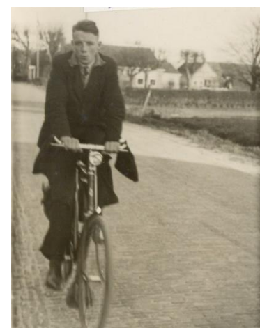
1938, op weg naar de Rijkskweekschool.